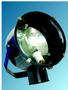
НО-01В, РО-01В, РО-02В, ЖО-02В, ГО-02В